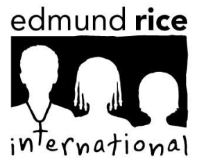
Honduras 2015